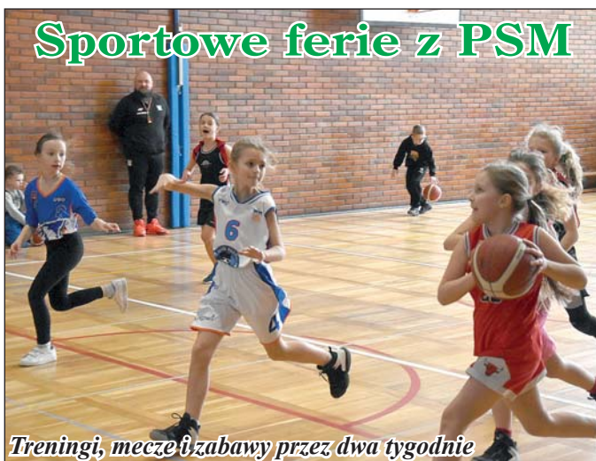
Treningi, mecze i zabawy przez dwa tygodnie