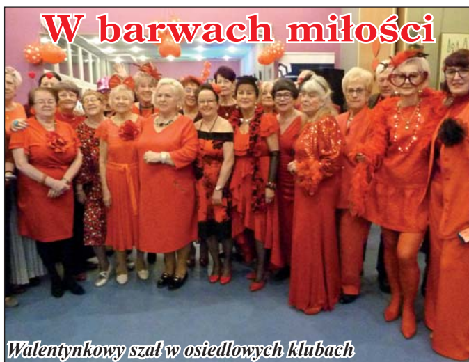
Walentynkowy szal w osiedlowych klubach