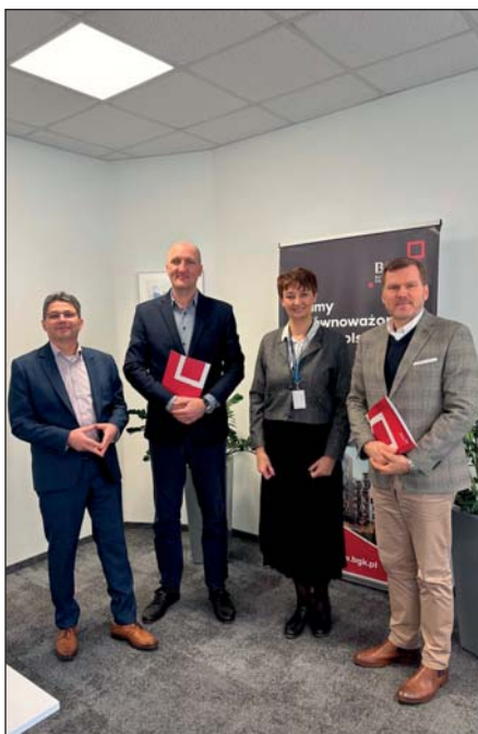
Podpisanie umowy na dofinansowanie termomodernizacji

PSM była jednym z pierwszych beneficjentów programu „Zielona transformacja miast” jednak jego realizacja dobiega końca. Dobrze więc, że zarząd spółdzielni sięga po dofinansowanie z programu „Europejski Fundusz dla Wielkopolski”. Warunki w jego ra-