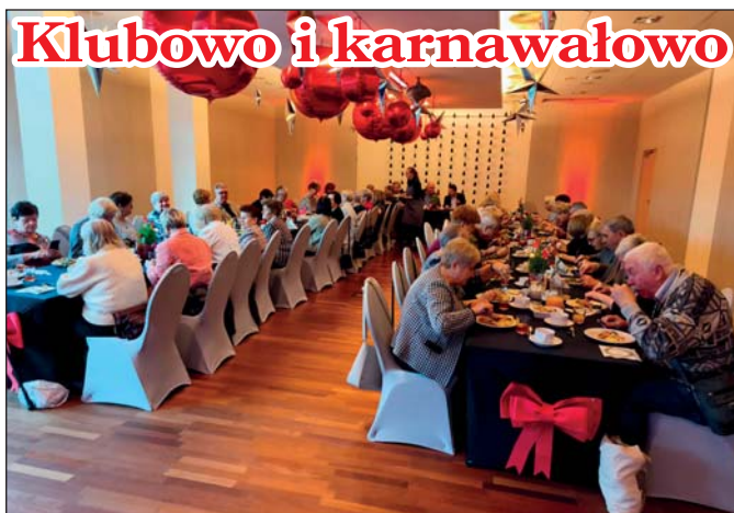
W osiedlowych klubach wiele jest okazji do spotkań, ciekawych zajęć oraz karnawałowych zabaw