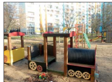
Trwają już przeglądy i modernizacje placów zabaw

Mieszkańcy osiedla z zadowoleniem powitali zakończenie modernizacji kolejnego parkingu przy budynku 6. Powstało na nim 75 miejsc postojowych. Zarządza nim obecnie administracja osiedla, w której mieszkańcy mogli wynająć dla swych pojazdów stałe miejsce. Cena jest atrakcyjna, gdyż wynosi zaledwie 100 zł za miesiąc, zainteresowanych więc nie brakuje. W