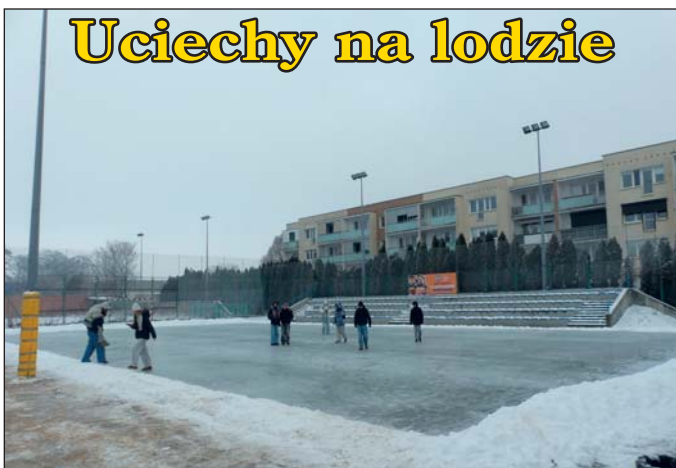
Boiska zamienione w lodowiska na osiedlach Jana III Sobieskiego i Stefana Batorego sprawiają dzieciom wiele uciechy