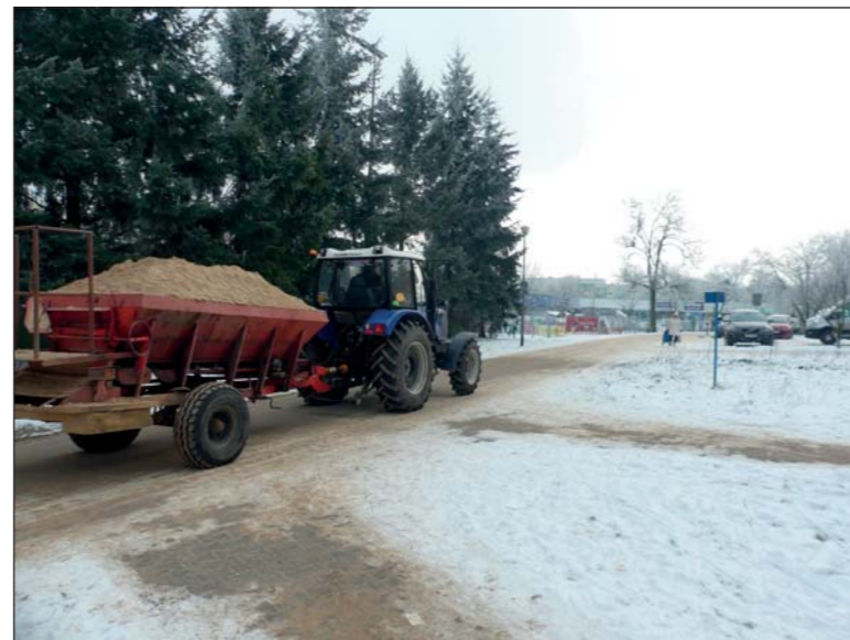
Na osiedlowe alejki rozsypano tej zimy tony piasku

dlowych ulicach, alejkach czy podejściach do budynków. Ekipy sprzątające i gospodarze domów mają co robić, skoro świt muszą usuwać śnieg oraz wysypywać znaczną ilość piasku i okazjonalnie również soli. Do połowy stycznia w ramach zimowego utrzymania rozsypano na osiedlu ok. 80 ton piasku. Podczas gołoledzi spełnia on swe zadania, jednak gdy nadejdzie odwilż trzeba będzie go zgarnąć z alejek. A to też wiąże się z kosztami. Tegoroczna akcja zimowa pochłonie więc sporo pieniędzy.