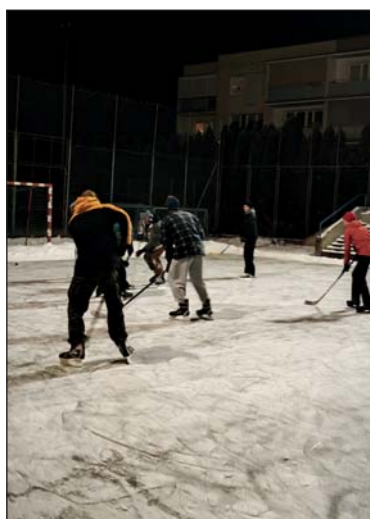
Rozgrywane są nawet w nim prawdziwe mecze hokejowe

Przed laty, gdy zimy były ostrzejsze, urządzano już na osiedlu podobne lodowiska, obecnie o tym prawie zapomniano. Wróciliśmy jednak do sprawdzonych rozwiązań. Pracownicy z ekipy zieleni wykonali na piłkarskim boisku obwałowanie ze śniegu i zaczęliśmy wylewać wodę a resztę zrobił już w nocy mróz. Następnego dnia można było już bezpiecznie szusować po lodzie. Utrzymanie lodowiska, które ma blisko 700 m kwadratowych po-