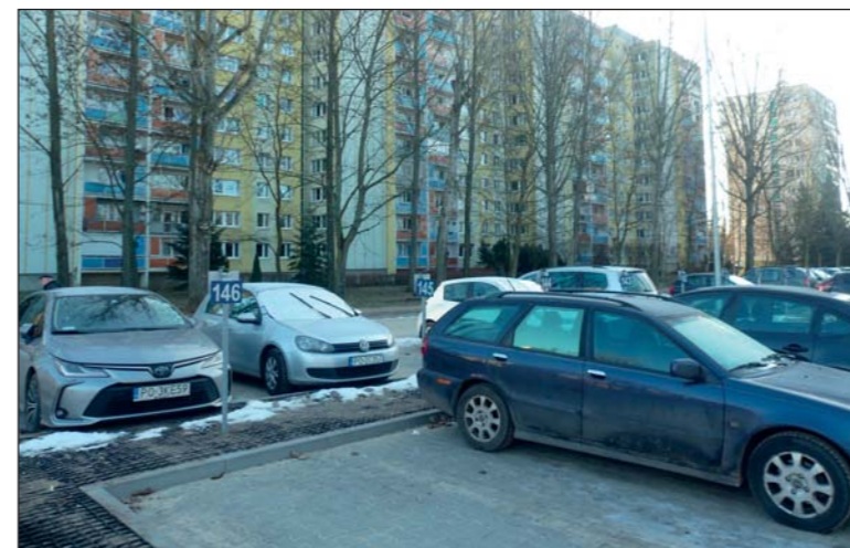
Na zmodernizowanym parkingu przy bloku 6 przybyło 75 miejsc postojowych

Największym przedsięwzięciem remontowym w tym roku będzie wymiana aż 26 dźwigów osobowych. Do tej pory udało się zmodernizować 40 z 74 działających od kilkudziesięciu lat wind. Upływ czasu daje się im we znaki, dlatego zdecydowano przyspieszyć ich wymianę i objąć jednym przetargiem więcej dźwigów by zmniejszyć koszty przedsięwzięcia. Wybrany w trwającym właśnie przetargu